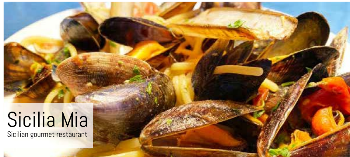
Sicilia Mia Sicilian gourmet restaurant

Top Storage | Lage Kaart 460 - 2930, Brasschaat | 03 651 30 30 | welkom@topstorage.be | www.topstorage.be