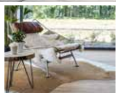
Parket Laminaat - Vinyl