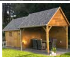
Tuinhuizen - Poolhuizen - Carports

Met een ruime keuze aan vloeren (parket, vinyl & laminaat), gevel- & wandbekleding, binnendeuren, timmer- & tuinhout, plaatmateriaal, BBQ's, terrasvloeren & tuinhuizen is Maxwood dé houtspecialist die kan meedenken, adviseren en begeleiden bij uw projecten.