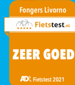
Fongers Livorno Dames 522 Wh