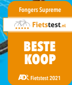
Fongers Supreme Disc 522 Wh